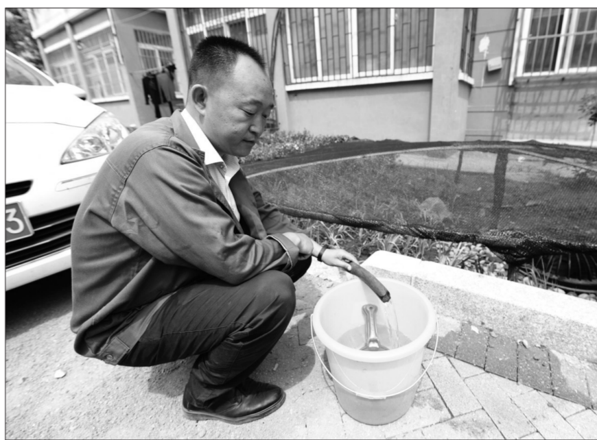
山东省青岛市首个“雨水整体处理”海绵化社区近日试点完工。据了解,老旧小区海绵化改造根据“雨水整体处理”的设计理念,采用了9种雨水处理措施,创造出可供雨水滞留、净化、下渗的区域,最终收集到模块化蓄水池。

年都开展一次局长大接访活动,至今已开展9年。近3年来,此项活动共接待群众133批次264人次,群众满意度达86.5%。南京市环保局设有专门环保投诉热线“12369”,24小时接听群众投诉,投诉量占每年环境信访总量的90%以上。