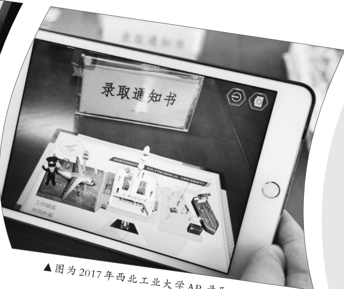
▲图为2017年西北工业大学AR录取通知书。