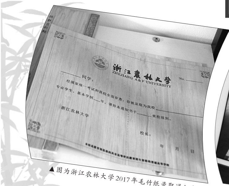
▲图为浙江农林大学2017年毛竹纸录取通知书。