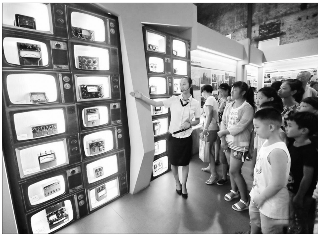
河北省秦皇岛市一社区近日组织辖区小朋友和家长共同走进秦皇岛电力博物馆,了解电力设备的更新换代、不使用空调的降温方式、如何节约用电等知识,让小朋友在学习历史文化的过程中体验节约用电,争做节能卫士。

研讨会旨在为我国从事相关领域研究的专家学者搭建国际交流平台。本次研讨会的主题为“环境法医学最新进展——从现场到法庭的最佳实践”,分设环境法医学最新进展、环境法医学与损害赔偿国际研讨会、环境法医学与损害赔偿国际研讨会、环境法医学与损害赔偿国际研讨会。