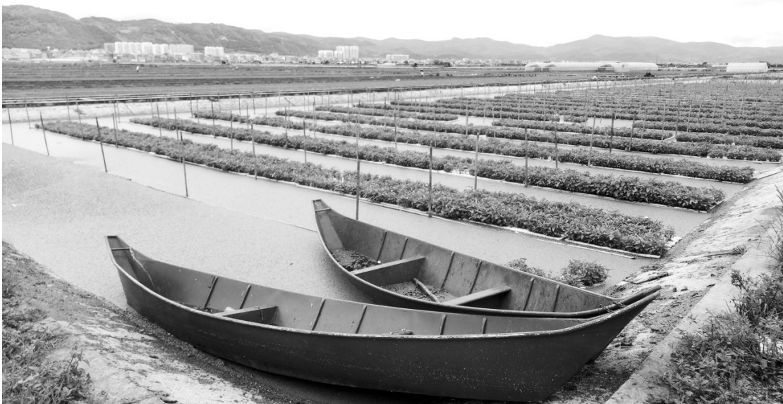
图为玉溪市通海县在杞麓湖周边利用调蓄沉淀塘进行无土栽培蔬菜的试点项目。