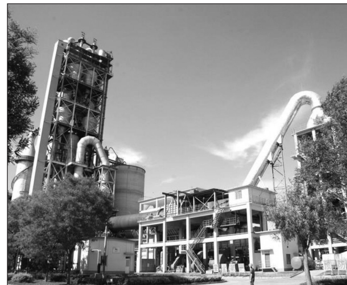
北京金隅集团集中优势资源成立金隅冀东水泥环保产业中心,推进旗下各水泥企业开展水泥窑协同处置项目建设。目前,公司在北京、河北、山西、吉林等地已建成并运行水泥窑协同处置危险废物的水泥企业8家,市政污泥处置企业4家,生活垃圾处置企业1家。图为北京金隅北水环保科技有限公司协同处置危险废物设施。