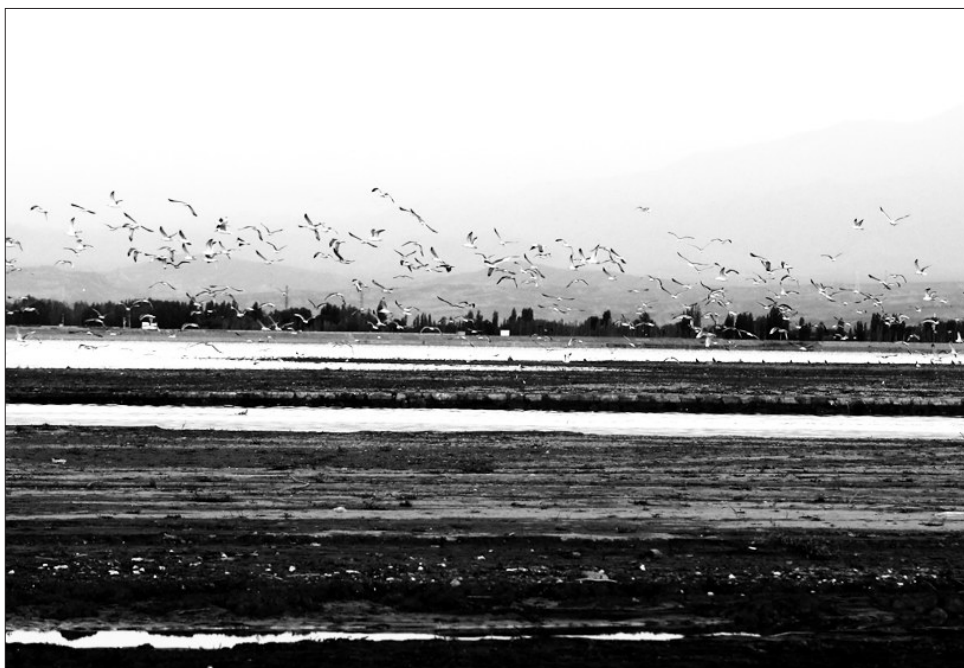
新疆五家渠青格达湖湿地是多种洲际候鸟迁徙的重要栖息驿站,每年秋季都会有大批鸟类南迁在此停留。图为黑鹳、野鸭、红嘴鸥、大白鹭等成群候鸟在湿地觅食、嬉戏。

本报记者钟兆盈杭州报道 浙江省杭州市近日公布了《杭州市党政领导干部生态环境损害责任追究实施办法(试行)》(以下简称《办法》),督促领导干部在生态环境领域正确履行职权,实现有权必有责、用权受监督、违规要追究。 《办法》明确提出,实行生态环境损害责任终身追究制,规定对违背科学发展要求、造成生态环境和资源严重破坏的,责任人不论是否已调离、轮岗、提拔或者退休,都必须严格追责。 《办法》规定,作出的决策与生态环境和资源方面政策、法律法规相违背等13种情形,将追究相关地方党委和政府主要领导成员的责任,并对其他有关领导成员及相关部门领导成员依据职责分工和履职情况,追究相应责任。 对于存在因未正确履行职责,导致应当依法由政府责令停业、关闭的严重污染环境的企业事业单位或者其他生产经营单位未停业、关闭等5种情形,将追究相关地方党委和政府有关领导成员的责任。同时,对政府有关部门领导成员应当追究情形也做了相应规定。 《办法》还构建起追责链条,明确了针对不同情节的处理规定,特别提出,地方党政领导干部若存在干扰、阻碍、不配合责任追究调查,或者拉拢、收买调查人员;弄虚作假、隐瞒事实真相;打击、报复、陷害检举人、控告人、投诉人、证人和调查人员等情节的,应当从重追责。