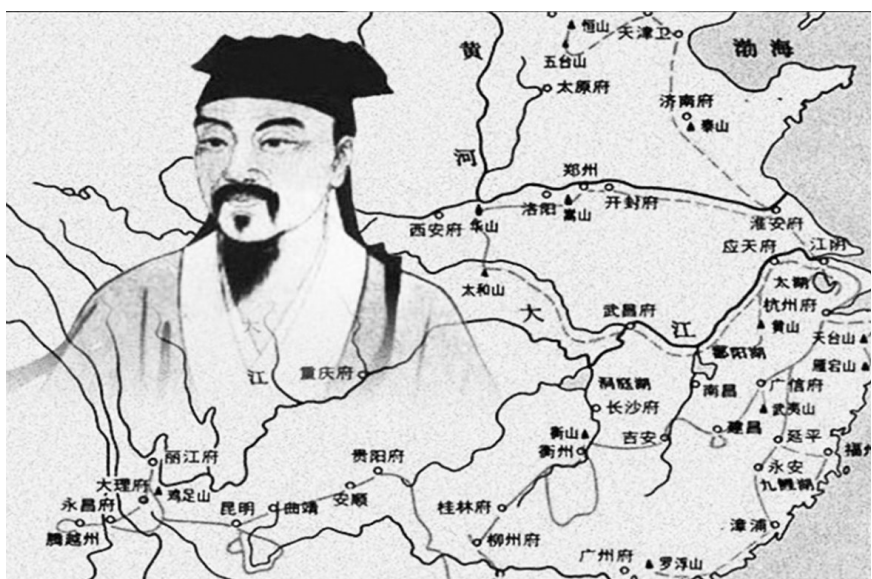
徐霞客旅行线路图