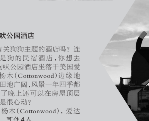
美国:狗吠公园酒店

你住过有关狗狗主题的酒店吗?连房子外形都是狗的民宿酒店,你想去看一看吗?狗吠公园酒店坐落于美国爱达荷州的白杨木(Cottonwood)边缘地区,周围草原田地广阔,风景一年四季都非常壮观,到了晚上还可以在房屋顶层看星星,是不是很心动?