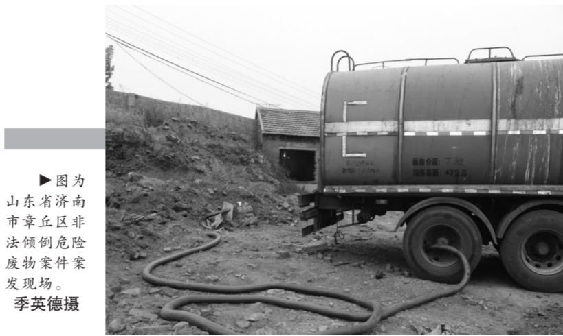
因为山东省济南市章丘区非法倾倒危险废物案件发现现场。

针对鉴定资质门槛过高问题,王安德也提出,目前环保系统市级以上监测机构和大量社会监测机构的实验