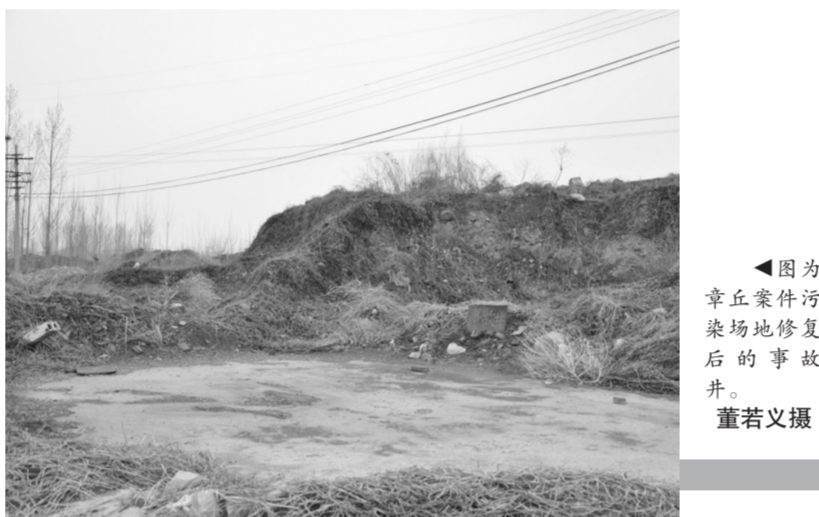
因为章丘案件污染场地修复后的事故井。

水利、公安、环保以及高等院校、科研机构、社会团体等不同领域近300名专家教授提交入库申请。经过报名、初审、遴选等程序,近日最终确定邱欣等61名在省内环境保护领域有突出成绩的专家入选专家库。