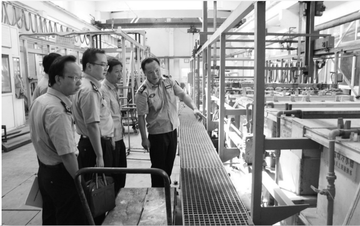
图为环保人员检查企业治污设施运行情况。