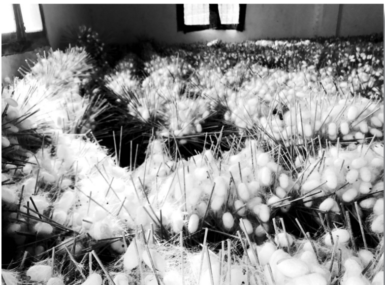
蚕桑养殖成为岳西农民主要的经济收入之一。图为岳西县茧丝绸蚕业专业合作社。

五年来,岳西县的经济总量持续增大,农业总产值从2013年的22.7亿元增加到2016年的28亿元,年均增速5.8%。农民收入快速提高,农村居民人均可支配收入由2013年的5612元增加到2017年的10558元,增速明显快于全市平均水平,特色扶贫、绿色发展的成效显著。在2017年3月21日的全国产业扶贫(湖北罗田)现场观摩会上,岳西县作了“创新产业扶贫机制 打好脱贫攻坚硬仗”的典型经验发言,得到各方认可。可见,岳西县初步形成了县域有机农业、特色农业、绿色发展、脱贫致富相结合的岳西模式。