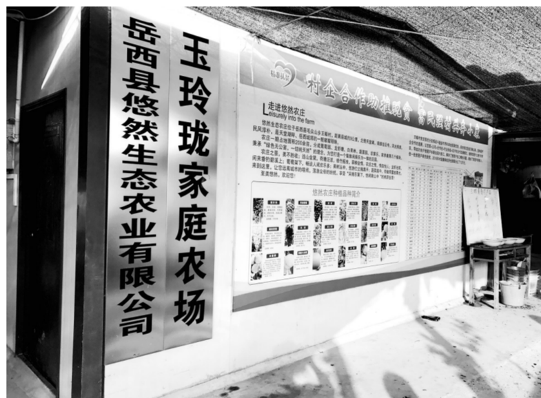
毛尖山乡王畈村的悠然葡萄园灌溉采取先进的滴灌技术,就地取用山泉水,节约了水资源,提高了葡萄的品质。

个,省级以上20个、市级25个、县级13个。2017年,“岳西茭白”扶贫案例在全国产业扶贫(湖北罗田)现场观摩会上印发交流,成为全国产业扶贫十大案例之一,并入选9月份中国国际农产品交易会(北京)产业扶贫展区。这些品牌的形成和外销,得益于物流、农村电商等现代服务业的形成和壮大。为了把品牌做强,正在新建标准化种植业基地2.16万亩,茶园4488.4亩(其中贫困村2844.7亩),组建茶叶社会化服务队41个(其中项目支持21个);发展生态中药材2020亩,新增旱地蔬菜870亩,茭白3440亩,改造茭白基地2250亩,组织主体创建省级蔬菜标准园,组织申报“中国高山茭白之乡”。