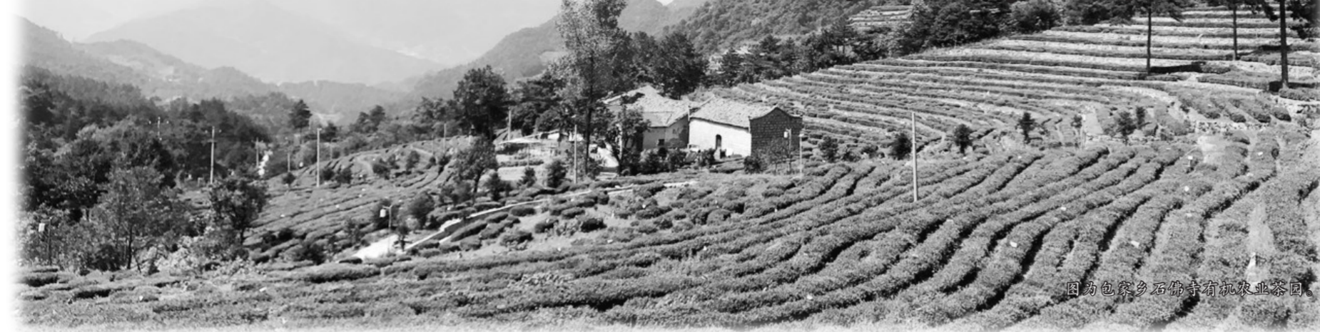
图为岳西县石佛山有机农业茶园。

2017年5月26日,中共中央政治局就推动形成绿色发展方式和生活方式进行第四十一次集体学习。中共中央总书记习近平在主持学习时强调,推动形成绿色发展方式和生活方式是贯彻新发展理念的要求,必须把生态文明建设摆在全局工作的突出地位。目前,各地都在探索符合自己基础和优势的绿色发展路径和方法。安徽省岳西县为了实现绿色发展,近年来严守生态红线,在空间格局、产业结构、生产方式、生活方式方面都进行了积极的探索,形成了优势产业,改善了就业,增加了农民收入,保护了环境,增强了生态文明建设的内生动力,初步实现了经济社会发展和生态环境保护的协同共进,为人民群众创造良好生产生活环境。