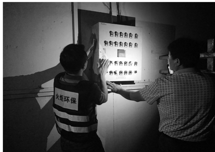
因为执法人员对家具厂两条喷漆生产线的配电箱张贴封条,进行查封。

下一阶段,火炬区环保部门将继续按照省环保督查组检查发现的问题整改落实好督查工作,对违法行为发现一宗,查处一宗,决不手软。 卢展欣