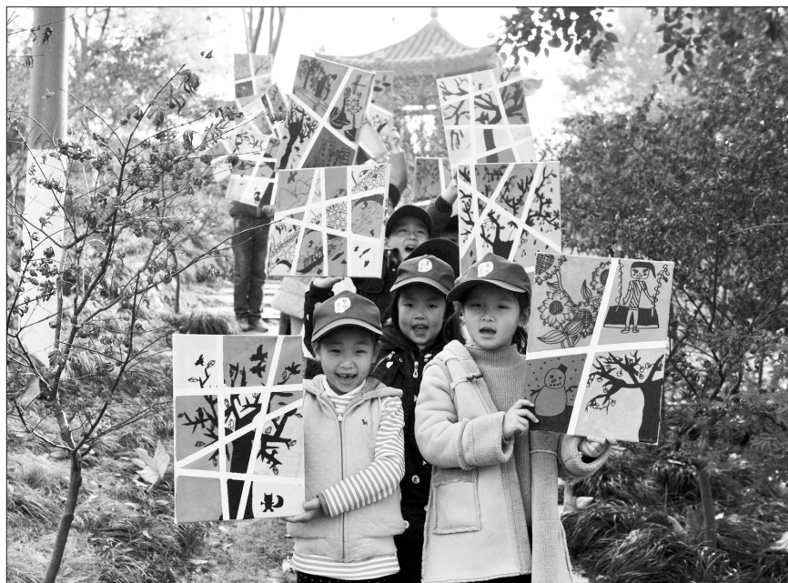
湖北省宜昌市夷陵区青少年活动中心近日开展“童绘美好新家园争做环保小使者”主题绘画创作活动,组织孩子们用画笔描绘美丽家园风景,用行动倡导绿色环保理念。图为小朋友在展示描绘的美丽家园风景。

下一步,临沂市将加大对县区和部门目标任务落实情况的问责力度。纪检部门将积极跟进,坚决处理一批、查办一批,做到“不负责就问责,不担当就挪位”,以强有力的督查问责推动采暖季大气污染防治攻坚取得实效。