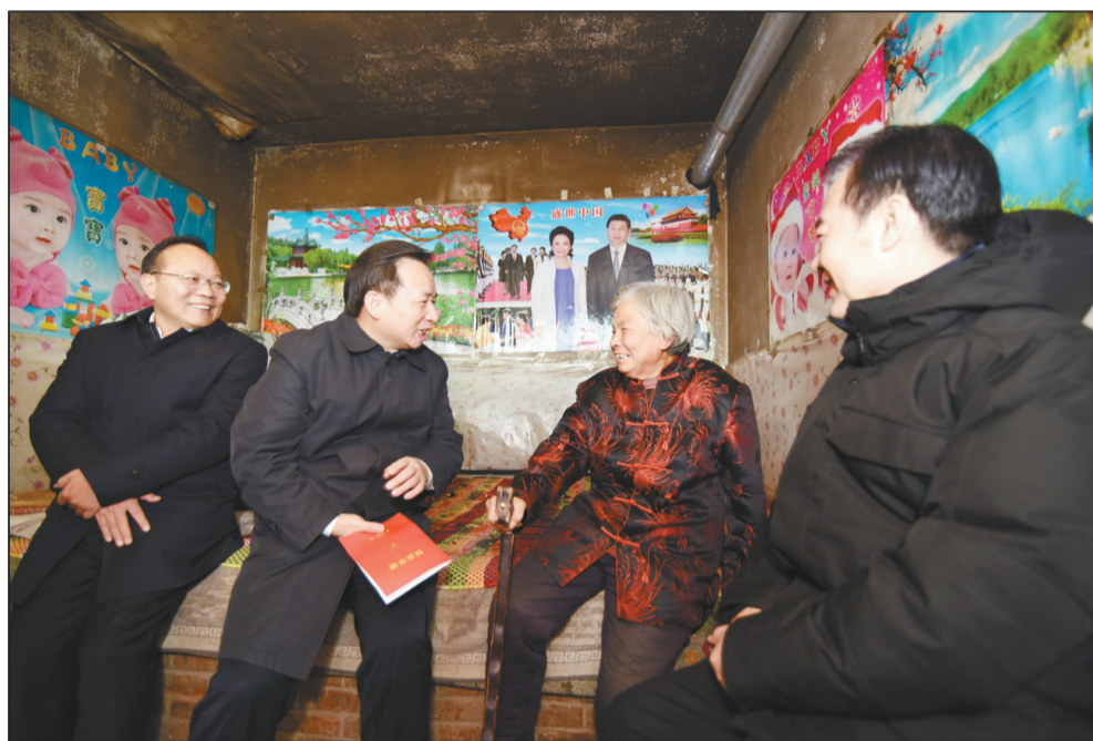
12月22-23日,环境保护部党组书记、部长李干杰赴河北省承德市围场、隆化两县开展定点扶贫调研慰问和督促检查。

本报记者杜宣逸 江滨报道 环境保护部党组书记、部长李干杰12月22-23日赴河北省承德市围场、隆化两县开展定点扶贫调研慰问和督促检查。调研期间,李干杰参观塞罕坝机械林场展览馆,走访慰问贫困户,查看扶贫项目,并召开定点扶贫工作座谈会。他强调,要深入学习贯彻党的十九大精神,弘扬塞罕坝精神,坚持绿水青山就是金山银山,努力实现脱贫攻坚和生态环境保护共赢。