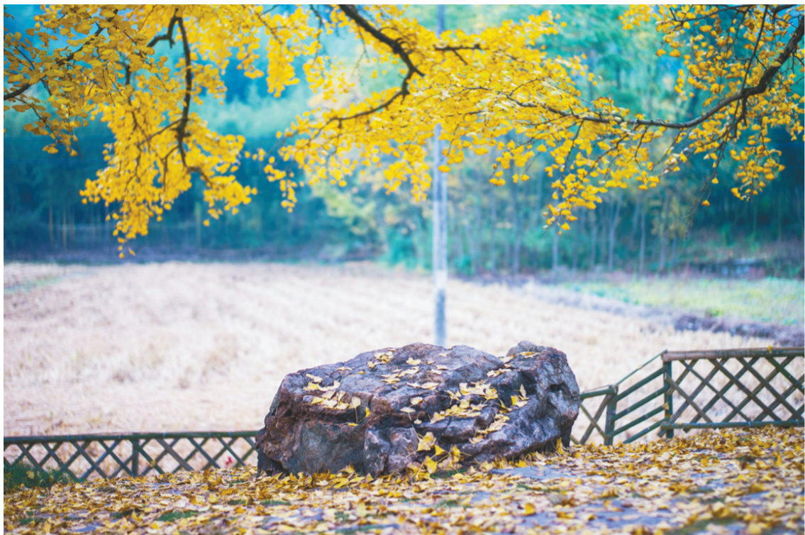
图为富阳区万市镇乡村风貌。