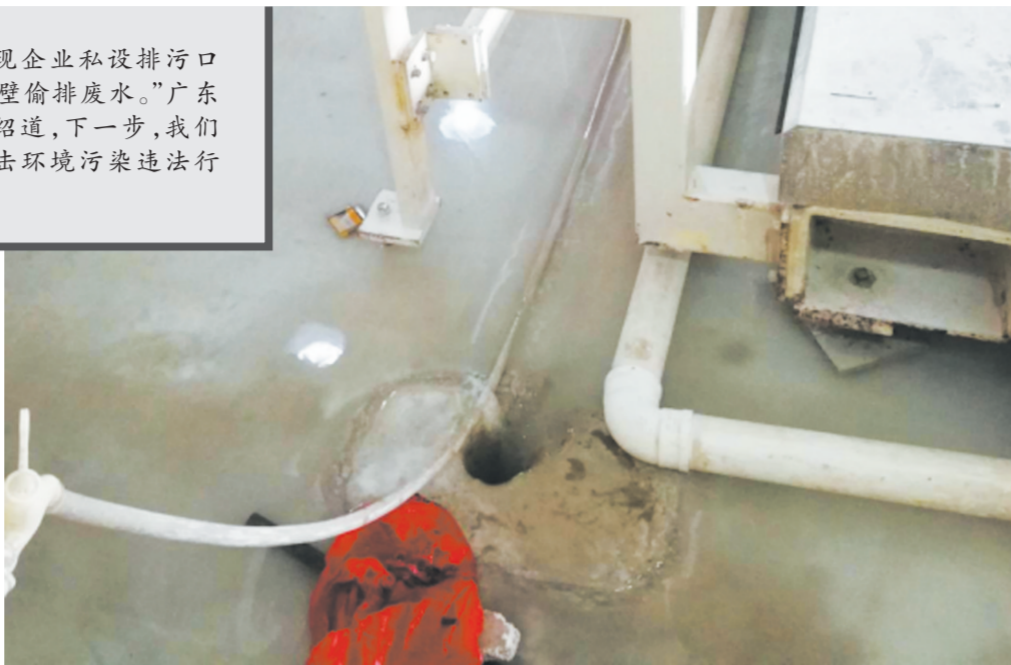
图为生产车间的偷排孔设有引流口,废水直接排入下水管道,并用红色胶袋遮掩。

“原本检查废气治理设施运行,却发现企业私设排污口排放污水。原本现场突击检查,却发现隔壁偷排废水。”广东省中山市阜沙环保分局副局长方亮彤介绍道,下一步,我们将采取零容忍的态度,有污必惩,严厉打击环境污染违法行为,努力清除环境污染“毒瘤”。