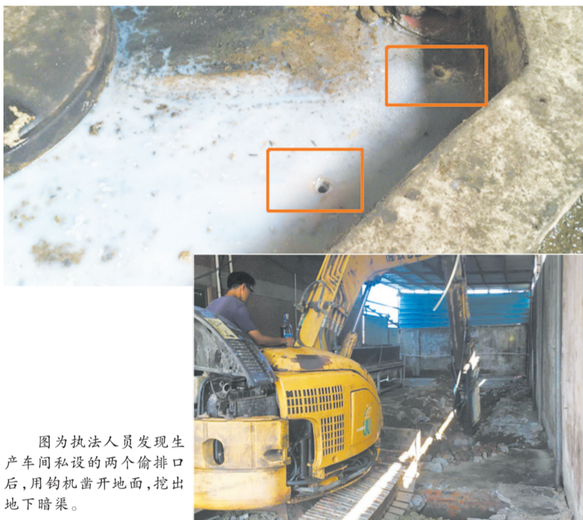
图为执法人员发现生产车间私设的两个偷排口后,用钩机凿开地面,挖出地下暗渠。

此外,阜沙环保分局还将对群众信访举报发现的偷排直排企业,通过查封扣押、移送公安、行政处罚等方式,从严从快查处环境违法行为,达到行政拘留或者刑事拘留的,一律移送公安机关依法处理,通过树立“反面典型”达到警示企业的目的。