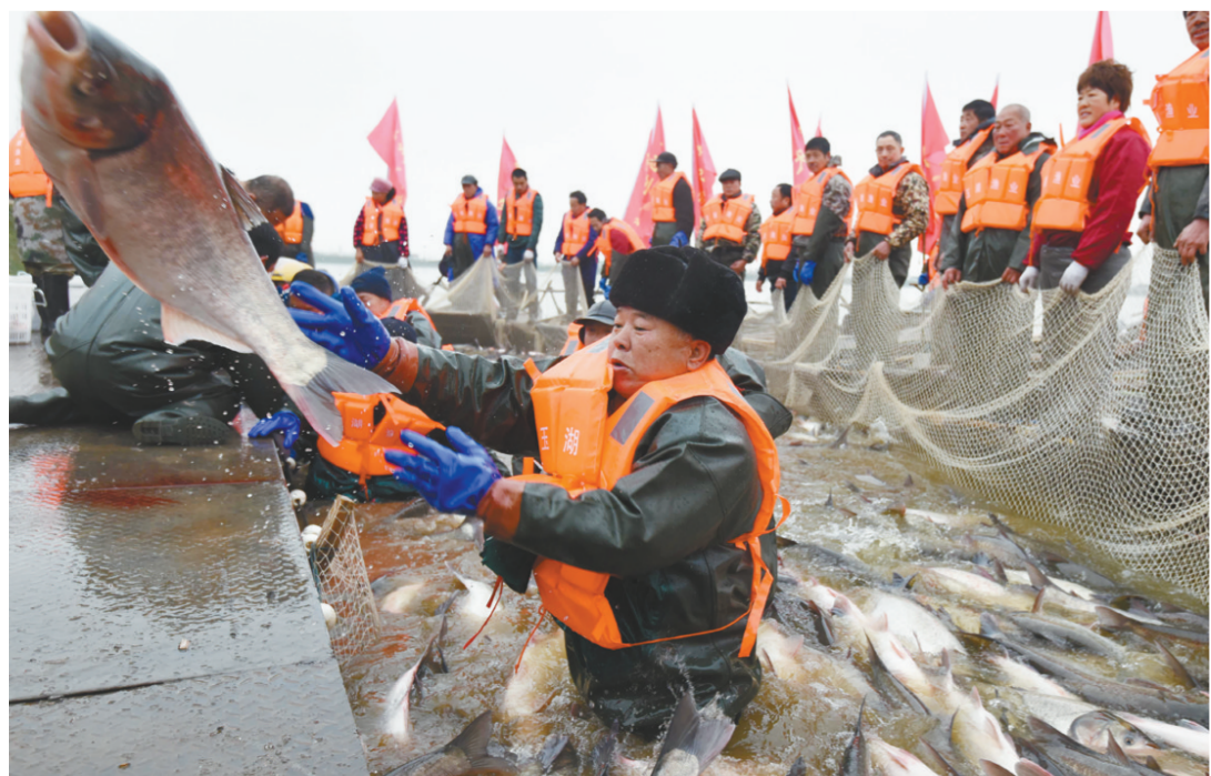
1月18日,湖北省公安县玉湖冬捕现场,一派鱼跃人欢的丰收景象。玉湖是当地重要的渔业生产基地,进入寒冬捕鱼时节,渔民通过冬捕保障春节前市场的鲜活供应。