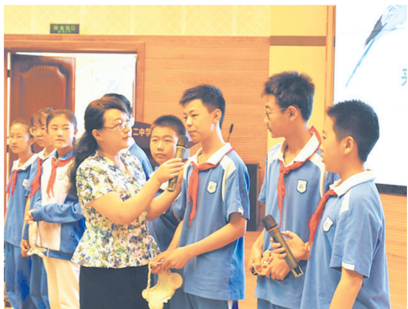
生态环境部宣教中心自然教育进学校暨天津市河东区六五环境日宣传教育活动启动仪式近日在天津市102中学举行。生态环境部宣教中心自然教育进学校专题培训班学员,102中学师生,河东区、和平区中小学校长近300人参加启动仪式。