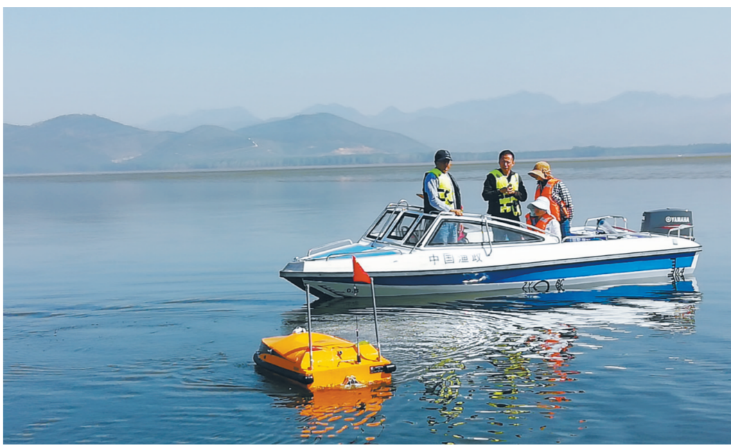
天津市生态环境监测中心积极利用科技手段为打好污染防治攻坚战提供保障。图为监测中心技术人员在蓟州区于桥水库利用遥控船查看水质状况并对水质进行检测。

扎实推进净土保卫战。全面完成农用地详查,严厉打击“洋垃圾”进口,进口废物许可量同比下降56.7%。