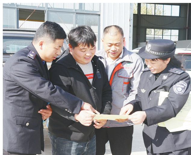
亳州蒙城县生态环境局工作人员在辖区企业进行生态环境执法检查。

下一步,亳州市将进一步推动生态环境保护工作向纵深发展。一是准备探索成立市级督察机构,结合正在实施的行政执法类事业单位机构改革,探索建立市生态环境督察支队。二是深化“物联网+网格化”大气污染防治监管。在行业主管部门监管基础上,将市中心城区网格化责任制监管延伸至乡镇,分片包干,强化巡查,定期联合巡查执法,实现行政执法、网格巡查有机结合,实现精准执法。借助AI智能污染识别,推进大气污染防治非现场监管,将工地施工、混凝土搅拌、车辆运输、垃圾及秸秆禁烧等大气污染防治重点工作纳入远程视频监控,实现全覆盖,自动识别施工扬尘、道路运输扬尘、机动车冒黑烟、焚烧等污染行为,第一时间推送所属网格员和行业主管部门,即时现场核实查处,提升污染整治效能。