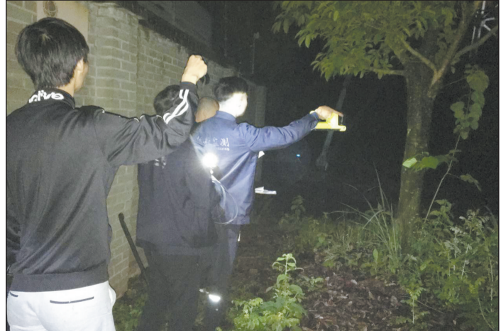
时间:2019年5月7日 地点:资阳市雁江区丰裕镇拱桥村

5月初,受生态环境部委托,四川省生态环境厅组织四川省辐射环境管理监测中心站在资阳市生态环境协同配合下,开展了川渝第三通道500千伏输电工程(四川部分)竣工环保验收监督检查。