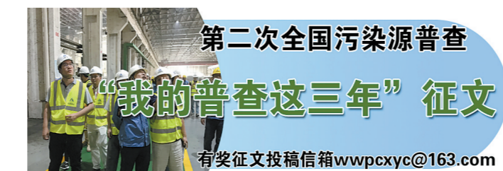
第二次全国污染源普查 “我的普查这三年”征文 有奖征文投稿邮箱wpxcyxc@163.com

伴生矿普查的复杂性要求联系通畅。伴生矿普查是一项浩大的工程,涉及31个省份15类矿产,时间跨度长、企业分布广、监测项目多、人员数量大,加之不同人员对同一文件的理解,会导致复杂多变且具有一定特殊性的现场情况出现,需要通畅的联系确保现场问题迅速上报和专