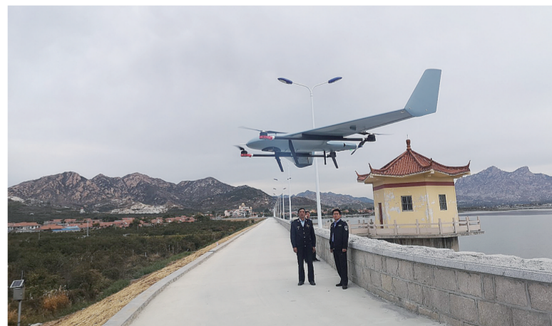
青岛生态环境系统使用无人机开展执法工作

明知征途有艰险,越是艰险越向前。在全面建成小康社会和“十三五”规划收官之际,青岛市生态环境局将紧密围绕污染防治攻坚战阶段性目标任务,坚定信心,奋勇前进,切实加强生态环境治理体系和治理能力建设,持续改善生态环境质量,提高人民群众对生态环境的获得感、幸福感,协同推动经济高质量发展和生态环境高水平保护,为实现“十三五”规划圆满收官和2035年远景目标、夺取全面建设社会主义现代化国家新胜利做出应有贡献。