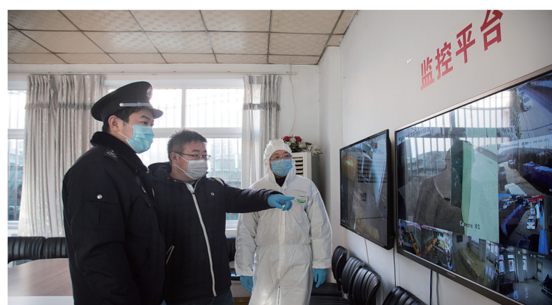
新冠疫情期间,青岛市加强对危废储运和处置单位的监管