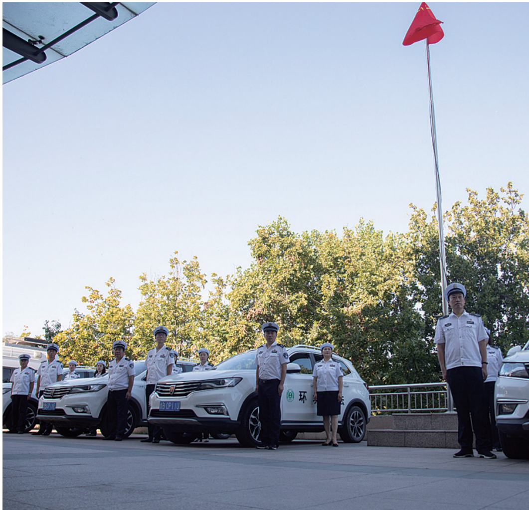
整装待发的青岛生态环保铁军

“要建设一支生态环境保护铁军,政治强、本领高、作风硬、敢担当,特别能吃苦、特别能战斗、特别能奉献。”近年来,山东省青岛市生态环境系统坚持从意识形态、选用培养、实践历练、夯基提能、监督管理“五大体系”入手,狠抓党的建设、队伍建设、能力建设“三项建设”,突出精准治污、科学治污、依法治污“三个治污”,为青岛市生态环保铁军精神融入“青岛元素”,培育“青岛特色”,全面助力坚决打赢污染防治攻坚战。