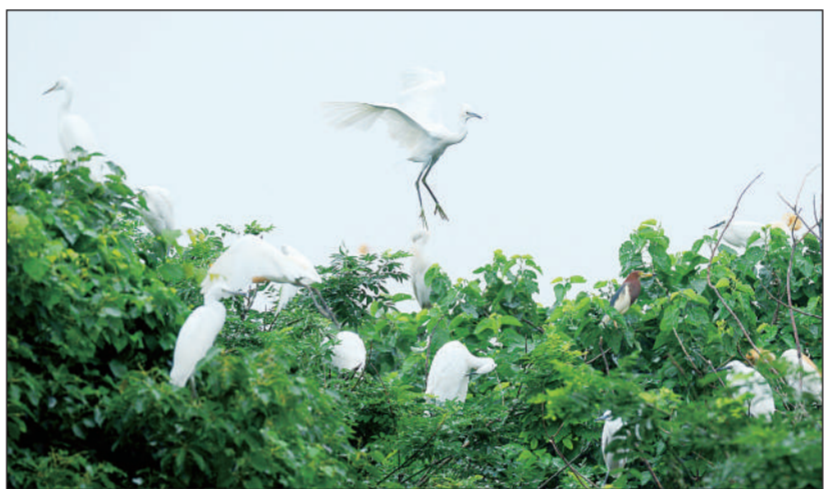
江苏省太仓市沙溪镇庄西村一片树林里成群的鹭鸟日前在林间翩跹起舞。近几年来,沙溪镇加强环境治理,生态环境明显改善,成为鸟儿栖息的天堂。

2020年4月,重庆市生态环境局、四川省生态环境厅签订了《危险废物跨省市转移“白名单”合作机制》。2020年11月,重庆、四川、贵州、云南四省市签订《关于建立长江经济带上游四省市危险废物联防联控机制协议》与《四川省危险废物跨省市转移“白名单”合作机制》。全市土壤环境质量总体保持稳定。 程竹青 代渝露