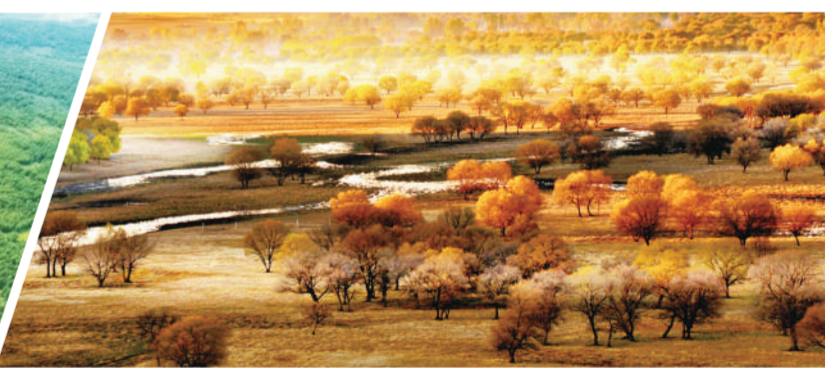
国家生态文明建设示范区、“绿水青山就是金山银山”实践创新基地—兴安盟