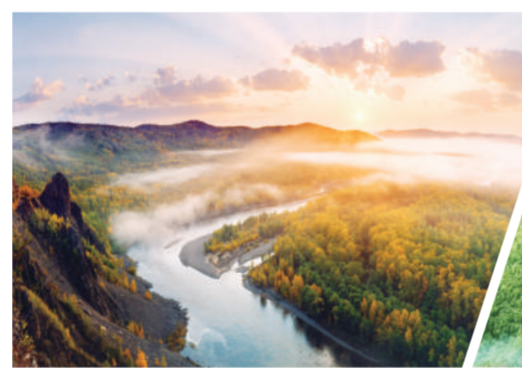
国家生态文明建设示范区、“绿水青山就是金山银山”实践创新基地—呼伦贝尔市根河市

24家,完成燃煤散烧整治11.59万户,指导推动包头市列入国家清洁取暖改造城市范围,建成自治区级及中西部6个盟市重