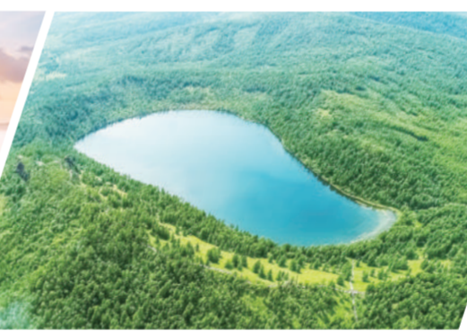
国家生态文明建设示范区、“绿水青山就是金山银山”实践创新基地—兴安盟阿尔山市