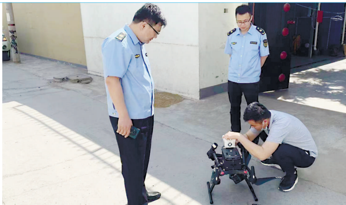
为持续改善大气环境质量,山东省枣庄市生态环境局市中分局日前使用搭载气体检测仪的无人机开展飞行巡查,共检查火电、砖瓦、供热等行业8家企业,并针对发现的3个问题要求企业迅速整改。