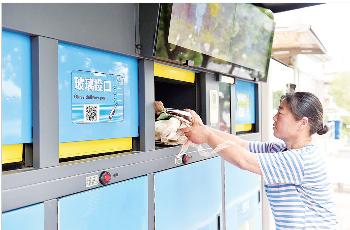
近年来,安徽省巢湖市黄麓镇建中行政村引入垃圾分类智能化系统,记录130余户本村村民每天易腐垃圾的总量以及每户垃圾分类情况。同时,建中村推出智能垃圾分类积分制,村民可通过积分兑换自己所需的生活用品。图为建中村村民近日在智能垃圾分类亭前投放垃圾。

在周边市场的带动下,秸秆产业发展势头旺盛。秸秆离田后的可选项增加了:一部分秸秆打捆后可直接运往周边利用企业,缩短储存时间,降低储存成本;另一部分质量较好的秸秆可以加工后销售给养殖企业、造纸企业,实现订单生产,创造更大的利润。根据秸秆质量不同,每吨可以实现30元—200元不等的利润,为秸秆收储企业长远发展提供了动力。韩东良 余梦佳