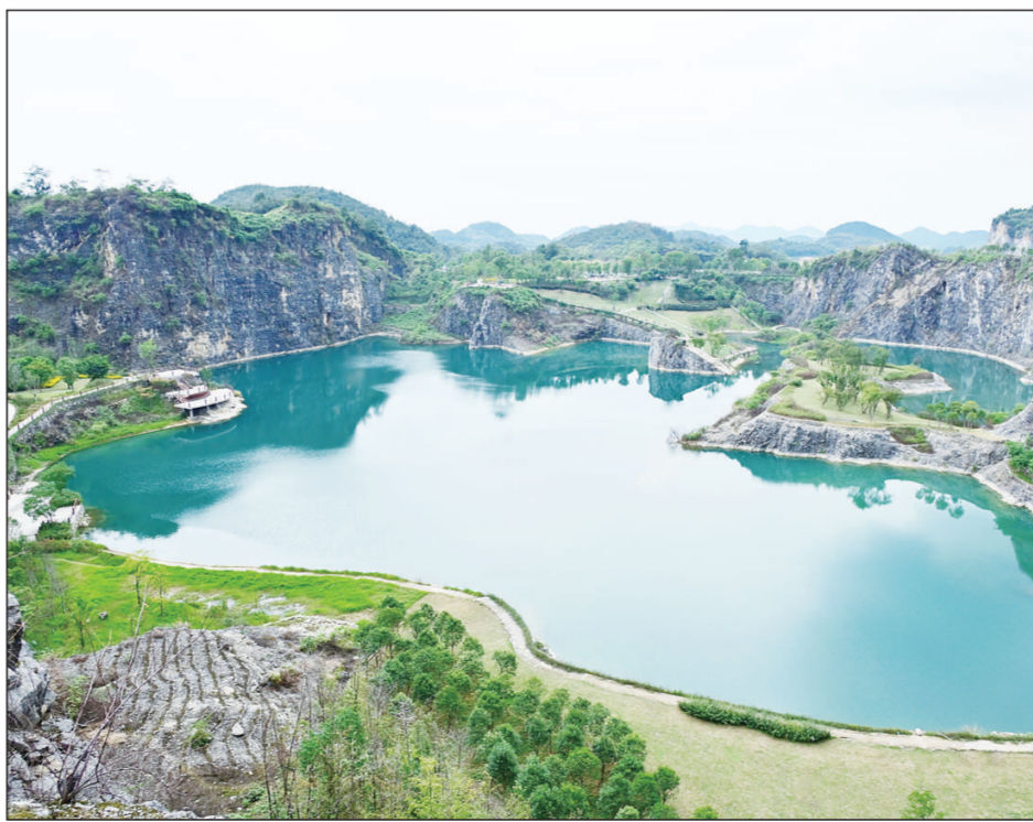
重庆市渝北区铜锣山矿山公园拥有41处石灰岩矿坑遗迹,其中有水矿坑12个,每个坑大小不一,形态各异。铜锣山曾是渝北区最大的石灰岩矿区,近年来,这个区投入资金对矿坑进行生态治理修复及绿化栽植,废弃矿坑“蝶变”成生态旅游胜地。