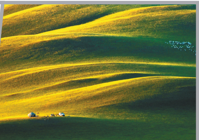
拥有良好自然生态的赤峰市