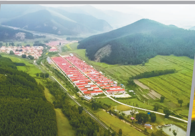
依托生态致富的小庙子村