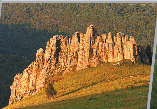
内蒙古克什腾世界地质公园石林