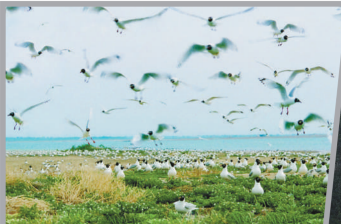
内蒙古达里诺尔国家级自然保护区

绿水逶迤去,青山相向开。一系列措施的深入实施,使赤峰市的生态环境质量得到明显改善。山更青了,水更绿了,蓝天更多了,风景更美了,绿色正在成为赤峰市的鲜亮底色。