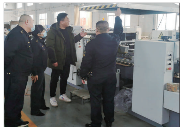
图为执法人员在企业开展普法宣传。董若义 赵珊珊供图

昌乐分局有关负责人介绍,昌乐分局目前形成了“前告知、中说理、后提示”的政策法规“订单式”靶向普法模式,注重前端化解违法风险,寓服务于监管之中,变“管理者”为“服务者”,持续提升企业规范守法内驱动力。