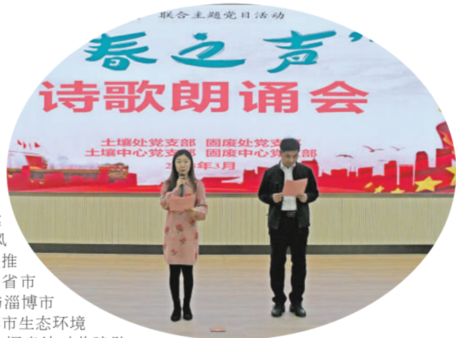
图为主题党日活动现场。